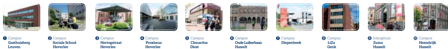
1 Campus Gasthuisberg Leuven 2 Campus Sociale School Heverlee 3 Campus Hertogstraat Heverlee 4 Campus Proximus Heverlee 5 Campus Clenardus Diest 6 Campus Oude Luikerbaan Hasselt 7 Campus Diepenbeek 8 Campus Liza Genk 9 Inloophuis Zuma Hasselt 10 Campus Hemelrijk Hasselt